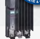
ET 200X Frequenzumrichter