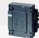
ET 200X BM Basismodule