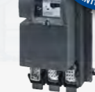
ET 200X Motorstarter

EM 300 DS DS2E EM 300 RS RS2E EM 300 EDS EDS2E EM 300 ERS ERS2E